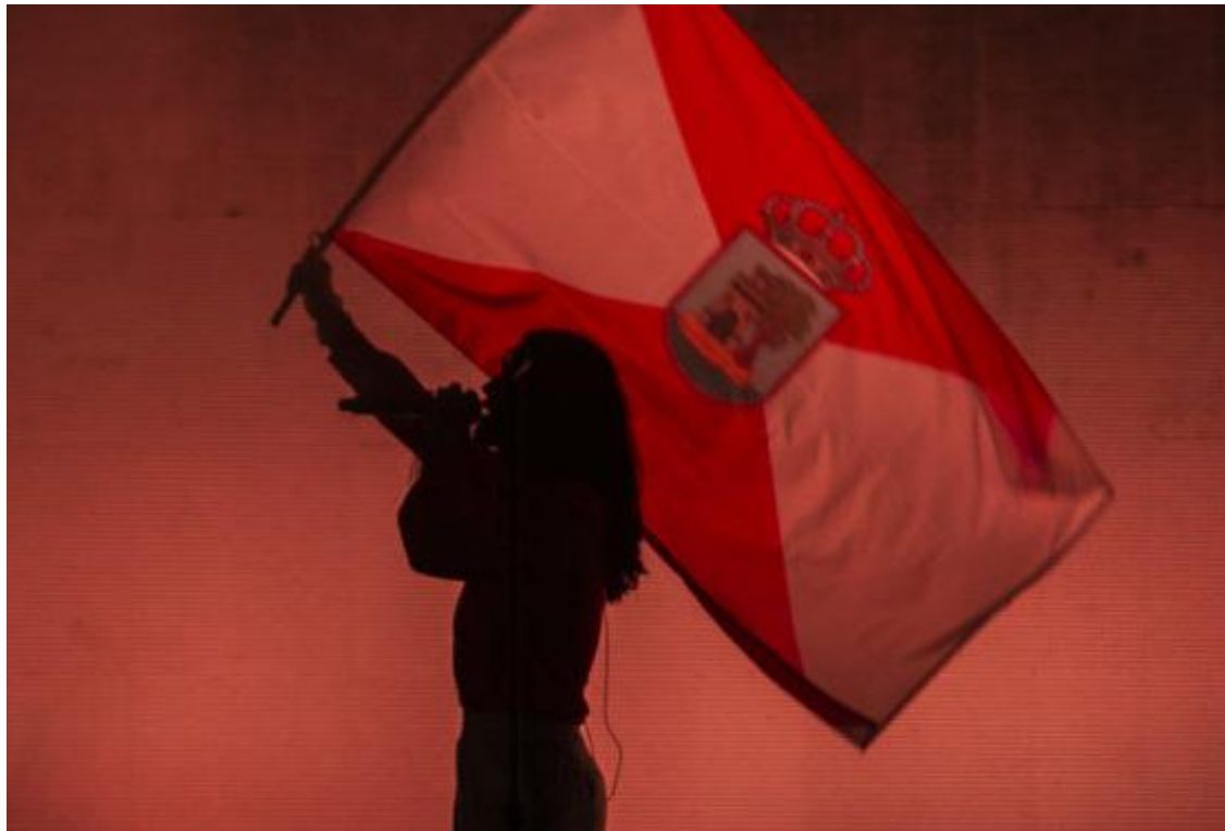
Jared Leto sostiene una bandera de Vigo durante el concierto que ofreció 30 Seconds To Mars en Castrelos en 2019.

La Asociación Amigos de los Pazos ha solicitado formalmente al Ayuntamiento de Vigo la revisión del actual escudo oficial de la ciudad, un emblema aprobado en pleno municipal el 7 de abril de 1987. El colectivo considera que tanto su diseño como su descripción contienen errores que vulneran las normas básicas de la disciplina heráldica y reclama una actualización rigurosa, coincidiendo con las obras de reforma del edificio consistorial.